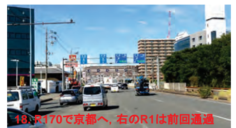
18. R170で京都へ, 右のR1は前回通過