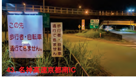
43. 名神道 京都南IC