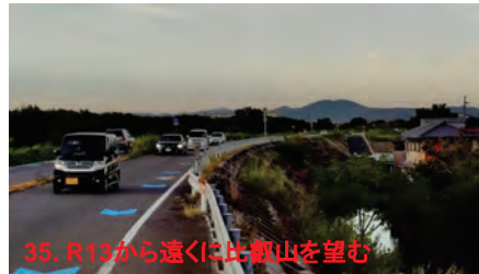
35. R13から遠くには比叡山を望む