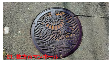
21. 枚方市マンホール