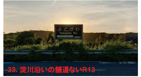
33. 淀川沿いの舗道ないR13