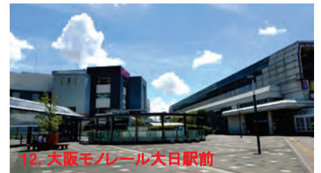
12. 大阪モノレール大日駅前