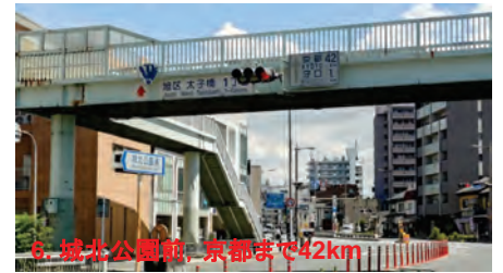
6. 城北公園前, 京都まで42km