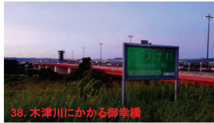
38. 木津川にかかる御幸橋