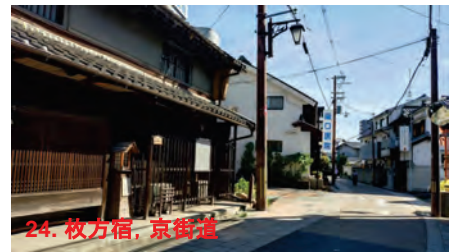
24. 杖方宿, 京街道