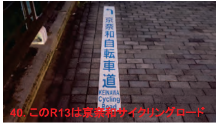
40. このR13は京奈和サイクリングロード