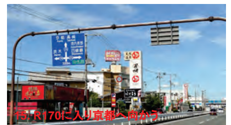
15. R170に入り京都へ向かう