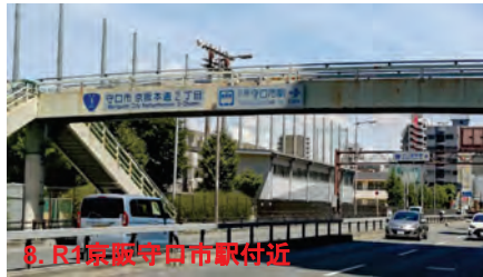
8. R1京阪守口市駅付近