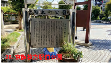
28. 京阪杖方駅前公園