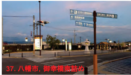
37. 八幡市, 御幸橋南詰め