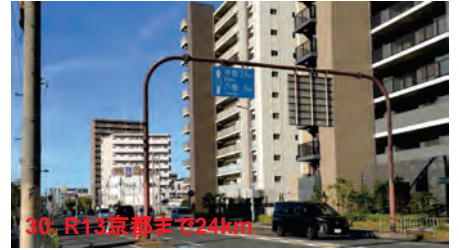
30. R13 京都まで24km