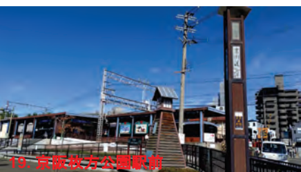
19. 京阪枚方公園駅前