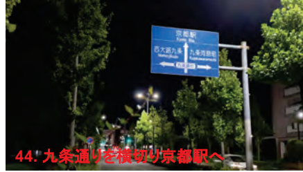
44. 九条通りを横切り京都駅へ