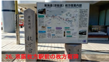
26. 京阪杖方駅前の杖方宿碑