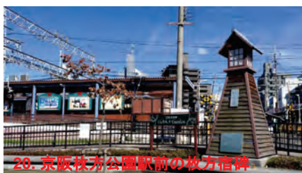
20. 京阪枚方公園駅前の枚方宿碑