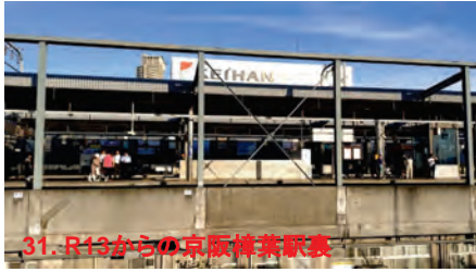
31. R13からの京阪博葉駅裏