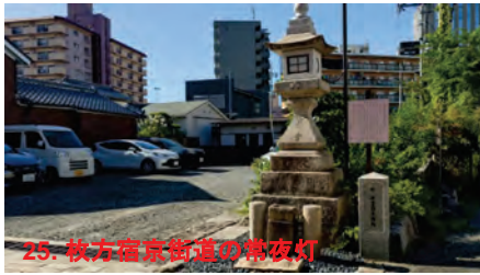
25. 杖方宿京街道の常夜灯