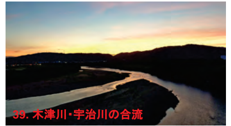
39. 木津川・宇治川の合流