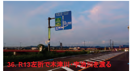
36. R13左折で木津川-宇治川を渡る