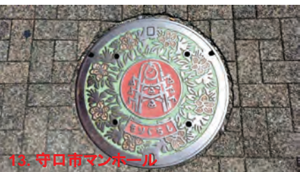
13. 守口市マンホール