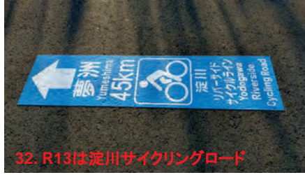
32. R13は淀川サイクリングロード