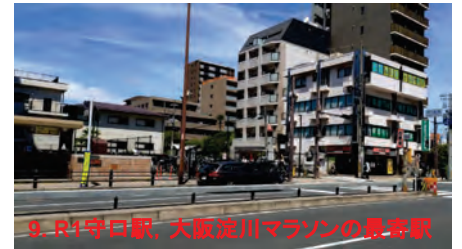
9. R1守口駅, 大阪淀川マラソンの最寄駅