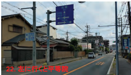
22. 左に行くと平等院