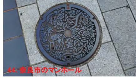
44. 奈良市のマンホール