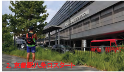
2. 京都駅八条ロスタート