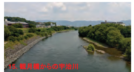
15. 観月橋からの宇治川