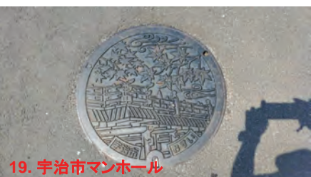
19. 宇治市マンホール