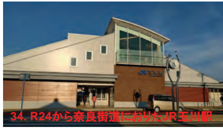
34. R24から奈良街道におりたJR玉川駅