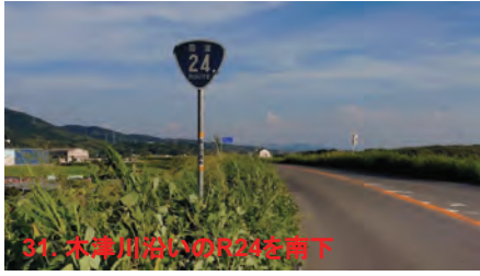
31. 木津川沿いのR24を南下