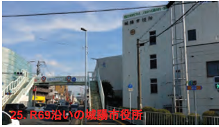
25. R69沿いの橿原市役所