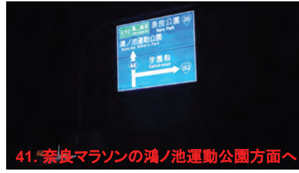
41. 奈良マラソンの鴻ノ池運動公園方面へ