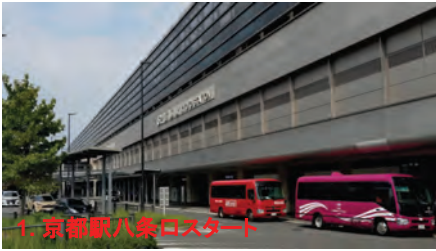
1. 京都駅八条ロスタート