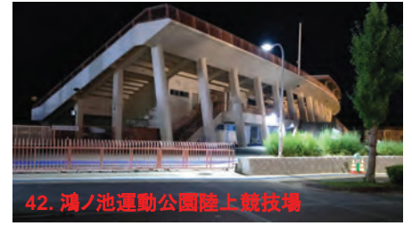
42. 鴻ノ池運動公園陸上競技場