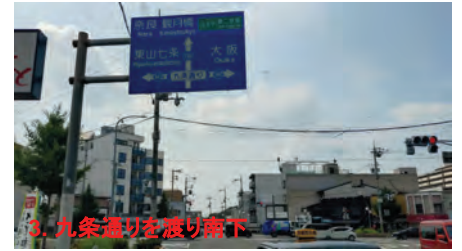
3. 九条通を渡り南下