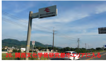
26. 関西文化学術研究都市エリアに入る