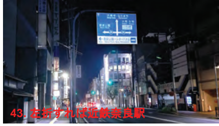
43. 左折すれば近鉄奈良駅