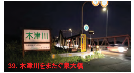
39. 木津川をまたぐ泉大橋