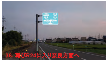
38. 再びR24に入り奈良方面へ