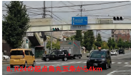
8. R24の起点丸丸五尖か5.4km