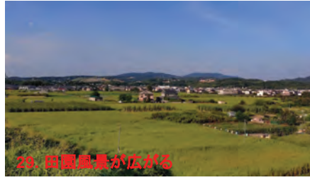
29. 田園風景が広がる