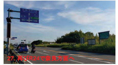
27. 再びR24で奈良方面へ