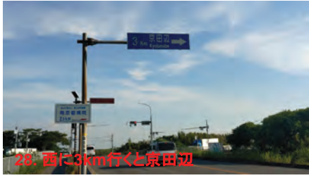
28. 西に3km行くと京田辺