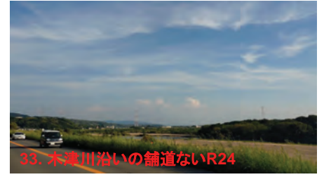
33. 木津川沿いの舗道ないR24