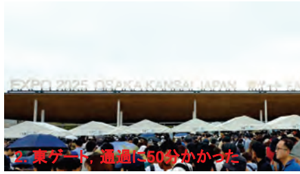
2. 東ゲート, 通過に50分かった