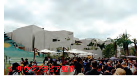
9. サウジアラビア館前