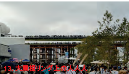
13. 大屋根リング上の人々