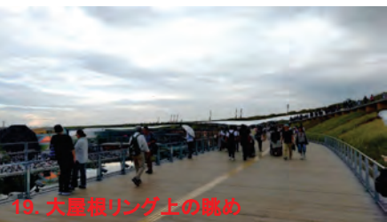
19. 大屋根リング上の眺め