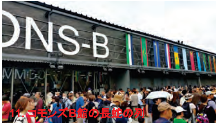
11. コモンズB館の長蛇の列