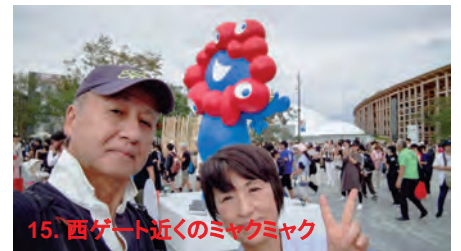
15. 西ゲート近くのミャクミャク