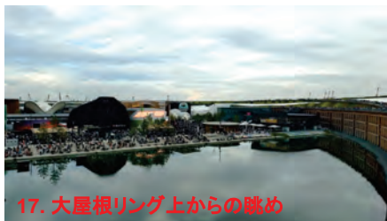
17. 大屋根リング上からの眺め