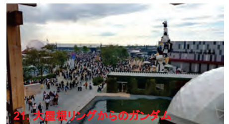
21. 大屋根リングからのガンダム