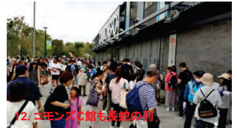
12. コモンズC館も長蛇の列