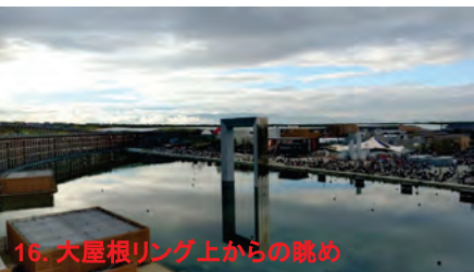
16. 大屋根リング上からの眺め