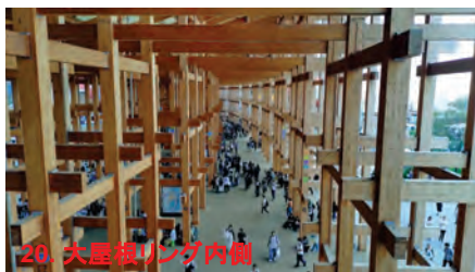
20. 大屋根リング内側