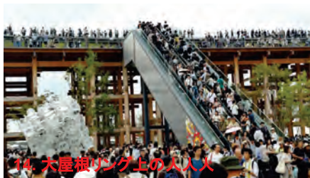
14. 大屋根リング上の人々