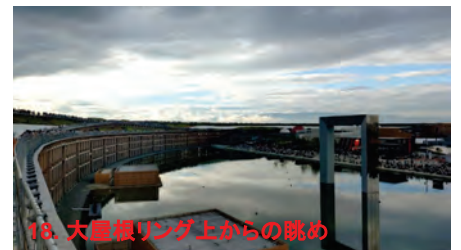
18. 大屋根リング上からの眺め