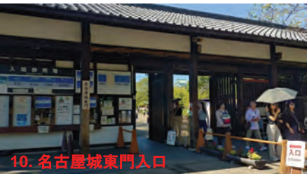
10. 名古屋城東門入口