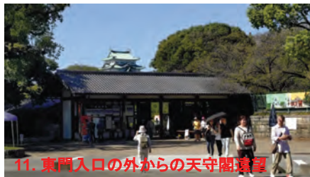
11. 東門入口の外からの天守閣遠望