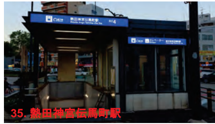
35. 熱田神宮伝馬町駅