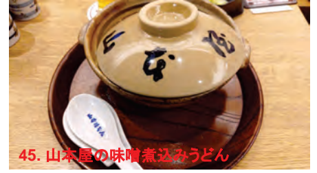
45. 山本屋の味噌煮込みうどん