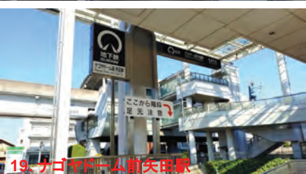
19. ナゴヤドーム前矢田駅