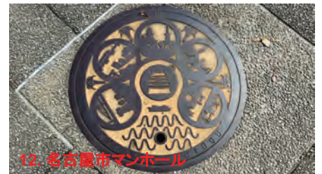
12. 名古屋市マンホール