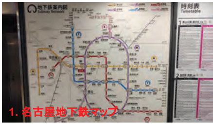
1. 名古屋地下鉄マップ