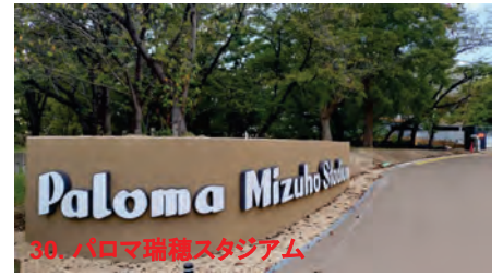
30. パロマ瑞穂スタジアム