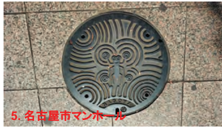
5. 名古屋市マンホール