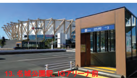
13. 名城公園駅、16アリーナ前