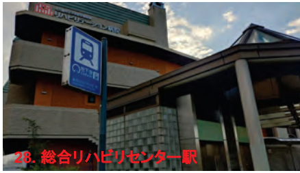
28. 総合リハビリセンター駅