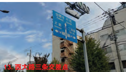
13. 西大路三条交差点