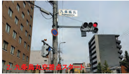
2. 九条烏丸交差点スタート