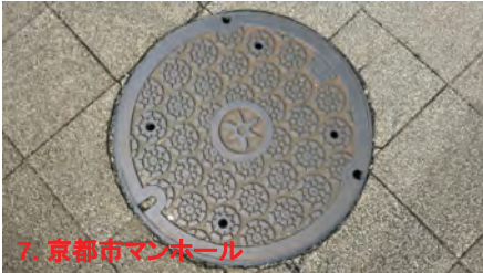
7. 京都市マンホール