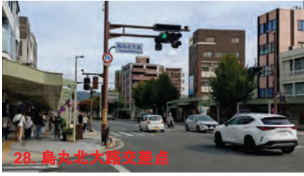
28. 烏丸北大路交差点