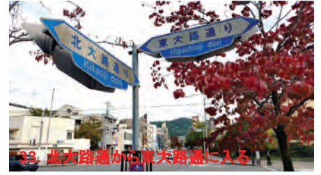
33. 北大路通から東大路通に入る