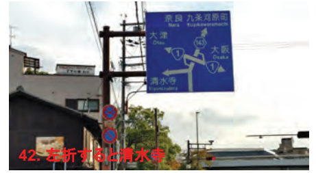
42. 左折すると清水寺