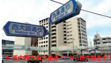
8. 西大路九条交差点から西大路を北上