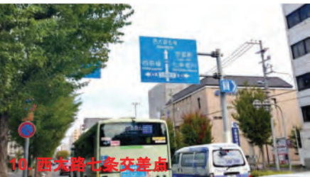
10. 西大路七条交差点