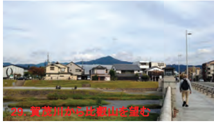
29. 賀茂川から比叡山を望む