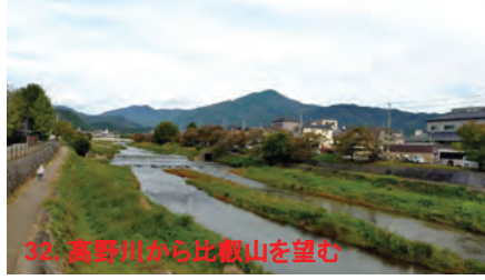
32. 高野川から比叡山を望む