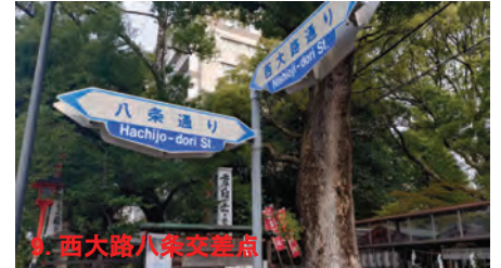
9. 西大路八条交差点