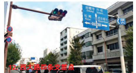
12. 西大路四条交差点