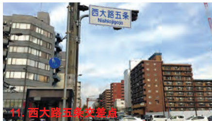
11. 西大路五条交差点