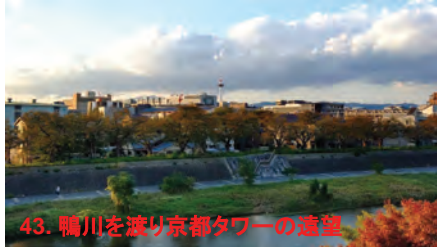
43. 鴨川を渡り京都タワーの遠望