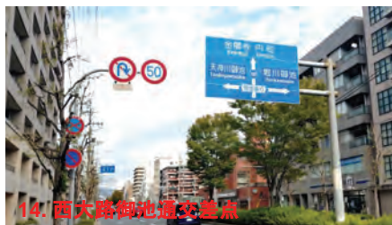
14. 西大路御池通交差点