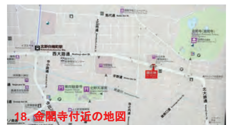
18. 金閣寺付近の地図