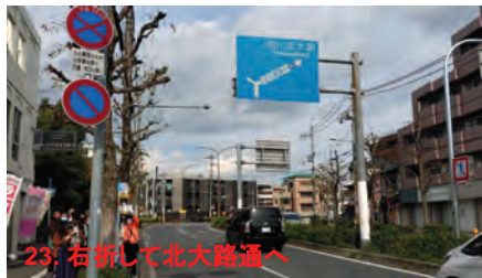
23. 右折して北大路通へ