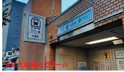
44. 九条島大でゴール