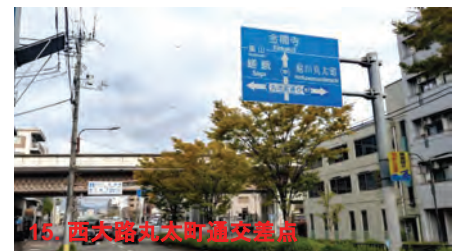
15. 西大路丸太町通交差点