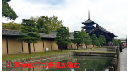
5. 東寺前の九条通を進む