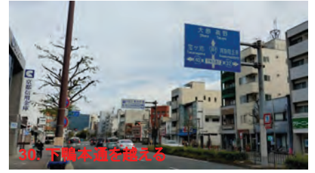
30. 下福本通を越える