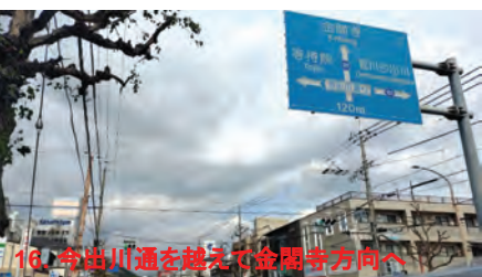
16. 寺出川通を越えて金閣寺方向へ