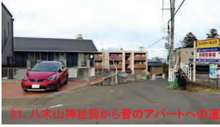
31. 八木山神社前から昔のアパートへの道