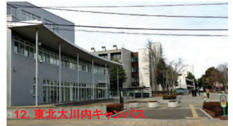
12. 東北大川内キャンパス