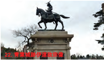
22. 青葉城跡伊達政宗像