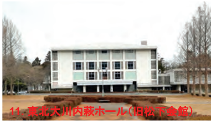
11. 東北大川内萩ホール(旧松下会館)