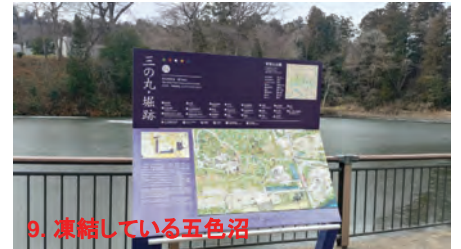
9. 凍結している五色沼