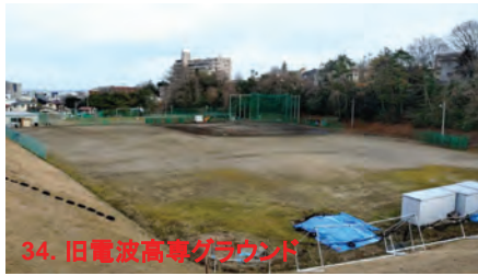
34. 旧電波高専グラウンド