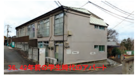
36. 42年前の学生時代のアパート