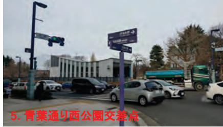
5. 青葉通り西公園交差点