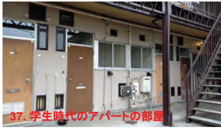
37. 学生時代のアパートの部屋