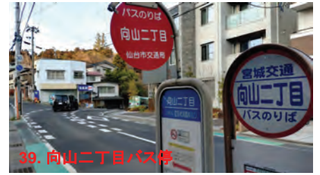
39. 向山二丁目バス停