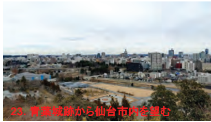
23. 青葉城跡から仙台市内を望む