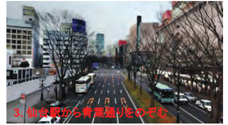
3. 仙台駅から青葉通りをのぞむ