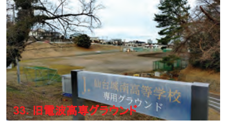
33. 旧電波高専グラウンド