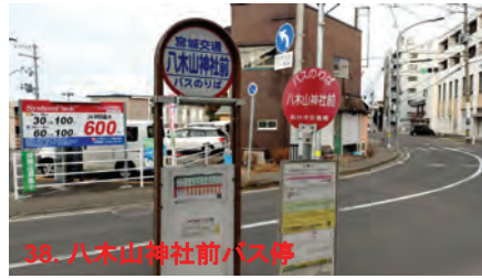
38. 八木山神社前バス停