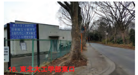
18. 東北大工学部東口