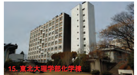
15. 東北大理学部化学棟