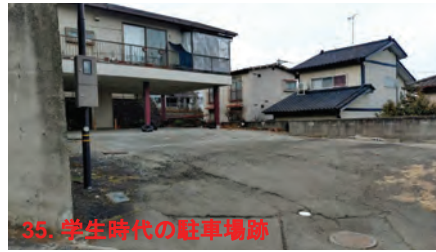
35. 学生時代の駐車場跡