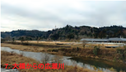
7. 大橋からの広瀬川