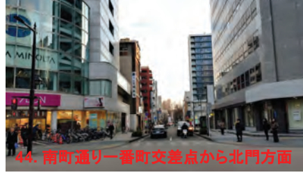
44. 南町通り一番町交差点から北門方面