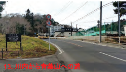
13. 川内から青葉山への道