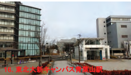
16. 東北大新キャンパス青葉山駅