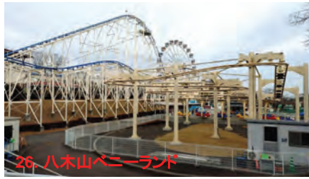
26. 八木山ベニーランド