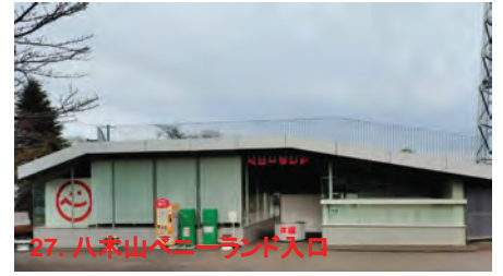
27. 八木山ベニーランド入口