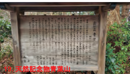
19. 天然記念物青葉山